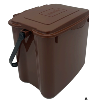
Bioeimer 7 L Abmessungen: 210 x 175 x 195 mm