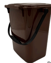
Bioeimer 10 L Abmessungen: 222 x 180 x 280 mm